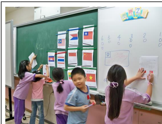
小組上台分享作品