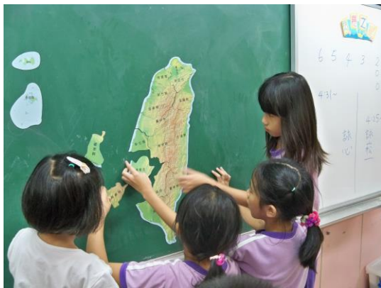
小組同心協力完成臺灣拼圖