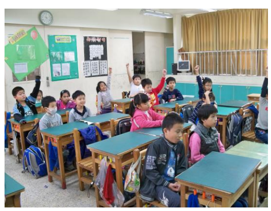
針對問題踴躍舉手發問