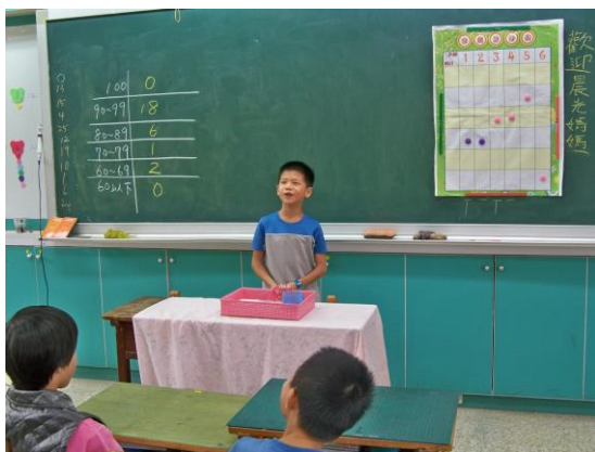
推派代表上台報告