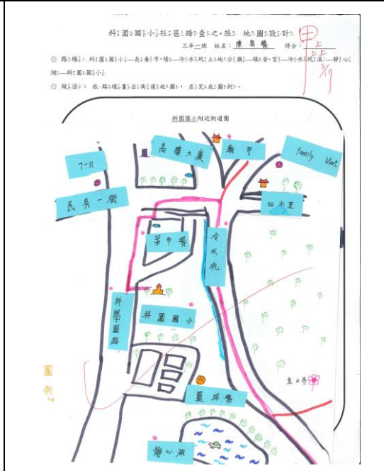
用心完成之社區踏查學習單