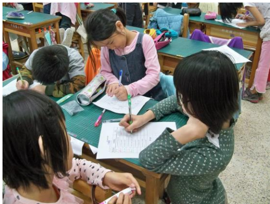
小組討論後，各自寫下紀錄。

學生層面：夥伴教師上課多以小組討論、遊戲學習單、獎勵制度、至圖書館蒐集文史資料以及小組上台報告等方式呈現。由下列資料中可看出學生大都能積極參與課堂活動。