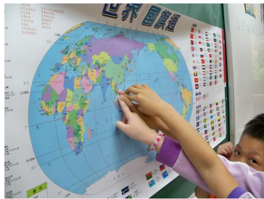
找找看，臺灣在哪裡？